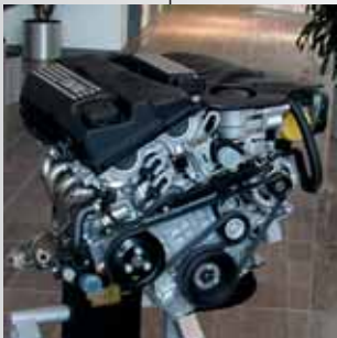
Der fertige Motor