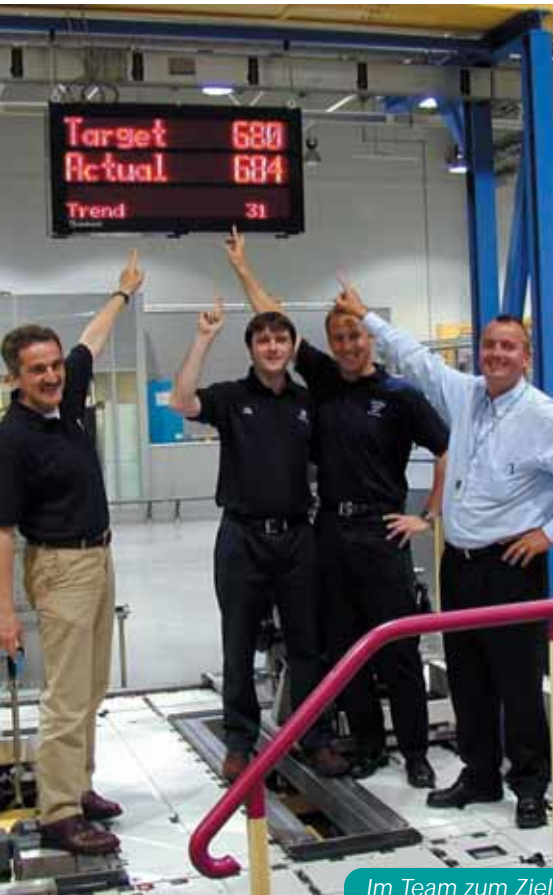
Im Team zum Ziel

professionelle Institution, die die Dinge aus einem unabhängigeren Blickwinkel betrachtet. Und genau das haben wir gebraucht: Den Blick aus einer neuen Perspektive. ROI haben wir beauftragt, weil das Unternehmen bereits Erfahrung mit der BMW Gruppe hat. Zudem ist ROI vollkommen neutral und kann daher wichtige, aber unbequeme Fragen stellen. Das hat richtig gut funktioniert! ■