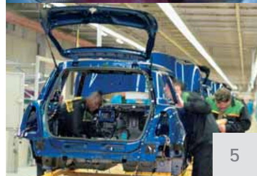
Linke Seite oben: Das BMW-Werk in Oxford oben: der Austin Mini Super Deluxe, 1964 rechts: Produktion im Werk Oxford